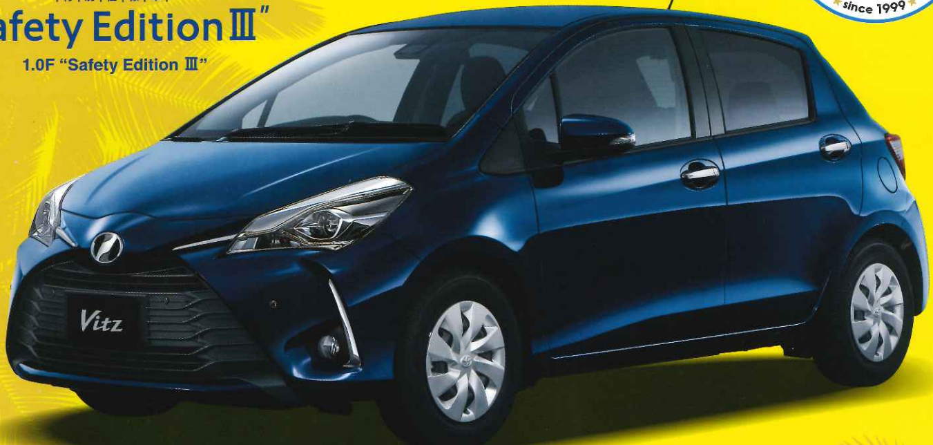
Photo: Vitz 特別仕様車 1.0F "Safety Edition III" (2WD) ボディカラーのダークブルーマイカ(8S6)は特別設定色